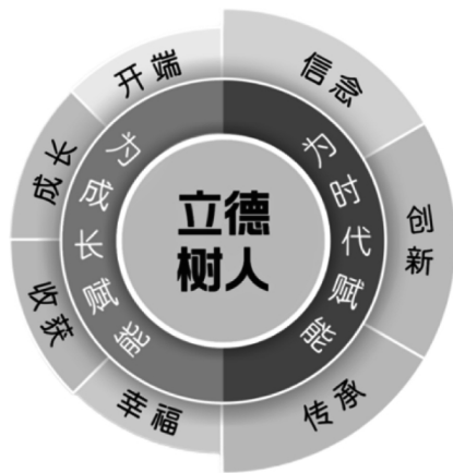
图1 “一核、两层、七维”劳动教育区域课程体系关系图

从立足个体全面健康发展,立足服务东莞经济社会发展的角度出发,以日常生活劳动、生产劳动和服务性劳动为主要课程框架,结合中小学各学段学生身心特点,依托东莞市特有的智能制造业等特色资源,创新智能制造教育课程,丰富劳动教育内涵、扎实推进劳动教育建设,形成了具有东莞特色的“一核、两层、七维”劳动教育区域课程体系。“一核”是紧紧围绕立德树人根本任务,“两层”是坚持劳动教育为每一位鲜活个体的成长赋能,坚持为社会主义建设者和接班人的时代赋能,其中“为每一位鲜活个体的成长赋能”包含“独立自主的良好开端、多彩生活的成长体验、出力流汗的坚毅收获、分享成果的幸福快乐”等四个维度要素,“为社会主义建设者和接班人的时代赋能”包涵“敢为人先的信念担当、突破自我的创新赋能、自强不息的文化遗产”等三个维度要素。图1是“一核、两层、七维”劳动教育区域课程体系关系图。